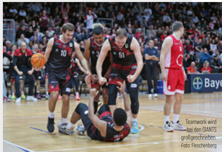
Teamwork wird bei den GIANTS großgeschrieben.

Wir wünschen Euch viel Spaß mit unserem Magazin und des Weiteren einen guten Start in das neue Jahr 2024 – bleibt gesund!