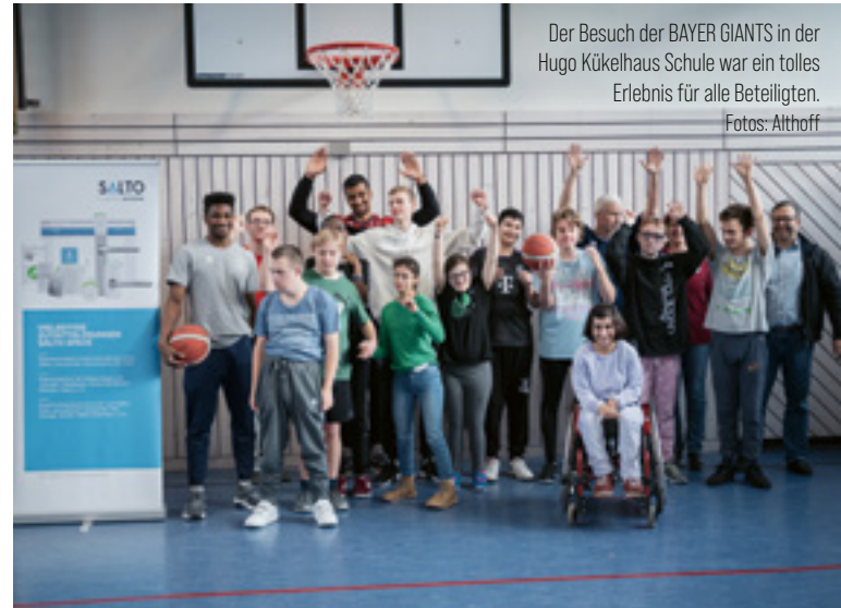
Der Besuch der BAYER GIANTS in der Hugo Kükelhaus Schule war ein tolles Erlebnis für alle Beteiligten.