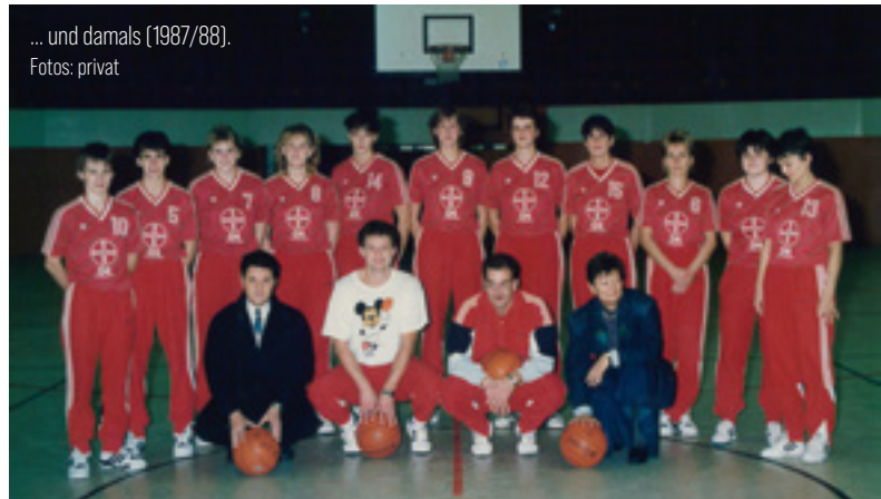
... und damals (1987/88).