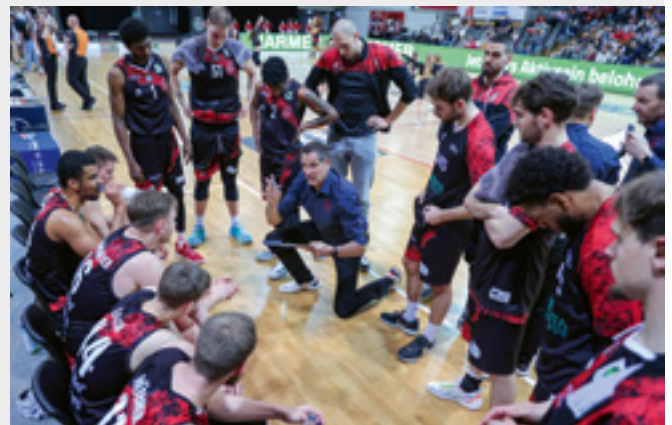
Als Team wollen die GIANTS die Tabellenspitze verteidigen.

Für Trainer Gnad ist klar, dass Spiel gegen Bernau kein einfaches werden wird: „Für beide Mannschaften geht es am letzten Spieltag um viel: Wir möchten gerne als Tabellenerster in die Playoffs gehen und Bernau möchte die Aufstiegsrunde erreichen. Spannung ist garantiert, umso wichtiger werden unsere tollen Fans sein. Unsere Anhänger müssen uns heute lautstark unterstützen!“