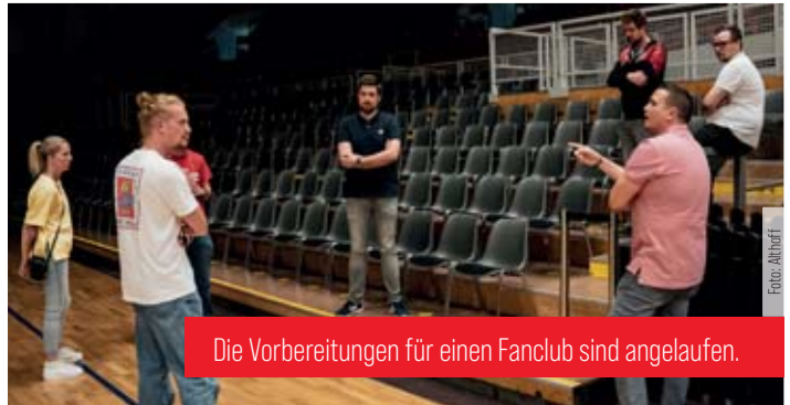
Die Vorbereitungen für einen Fanclub sind angelaufen.

In den knapp zwei Stunden sprach man über viele verschiedene Themen. Zum Beispiel ging es darum, wo die aktiven Stimmungsmacher in der Halle stehen können