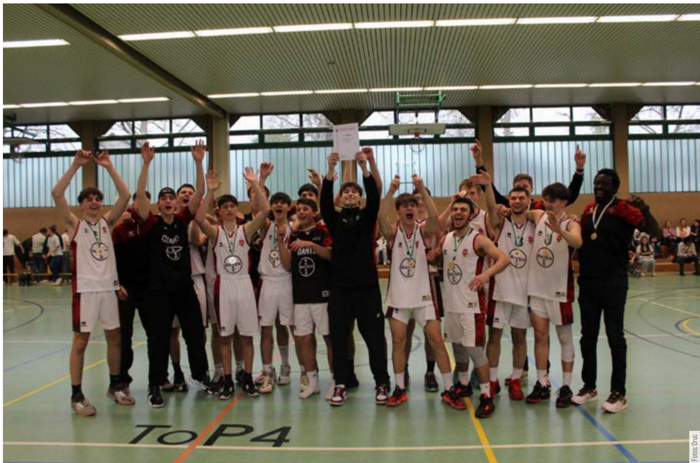
Die U18-Mannschaft hat den WBV-Jugendpokal gewonnen.