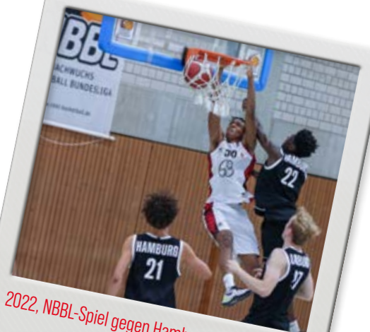
2022, NBBL-Spiel gegen Hamburg Towers.