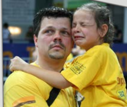
2008, letztes BBL-Spiel.